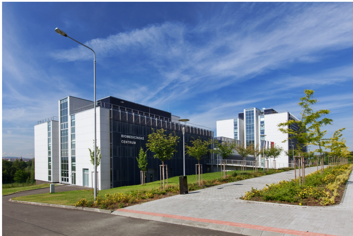
Biomedicínské centrum a první budova teoretických ústavů

Na tyto projekty OP VaVpl navázal v roce 2015 projekt dostavby Modré posluchárny s jídelnou. Ten byl podpořen z projektu Rozvoj a obnova materiálně technické základny Univerzity Karlovy.