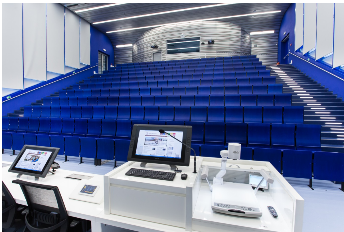
Interiér Modré posluchárny

V roce 2015 začaly přípravy dostavby zbývajících částí Univerzitního medicínského centra (zkráceně UniMeC). V roce 2016 byla podána žádost o dotaci OP VVV, ERDF výzvy pro VŠ na spolufinancování projektu výstavby a vybavení rozhodující části hlavní budovy. Tento projekt byl doporučen k financování a na podzim 2017 začala jeho realizace. U částí, které není možné spolufinancovat z projektu OP VVV (menza, děkanát) získala fakulta financování z programu 133 240 Rozvoj a obnova materiálně technické základny lékařských a pedagogických fakult veřejných vysokých škol. Vlastní stavební práce byly zahájeny v září 2019, stavba byla dokončena v červenci 2022 a od září 2022 běží v budově plný provoz. Do hlavní budovy kampusu se přestěhovalo zbylých devět teoretických ústavů, podpůrné provozy (Středisko vědeckých informací, Centrum informačních technologií, Provozní a technické oddělení) a děkanát. Funguje zde menza a kavárna.